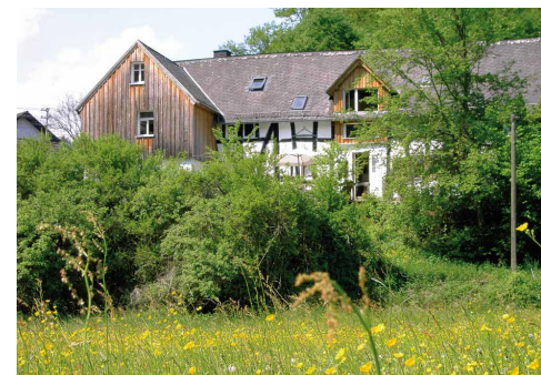
Seminarhaus in Alhausen, Westerwald