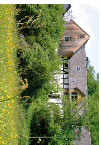
Seminarhaus in Alhausen, Westerwald

Hiernit melde ich mich verbindlich zur Teilnahme am Kurs „Journey into Kundalini Awakening“ 2019 am shunia Zentrum unter den in diesem Flyer genannten Bedingungen an. Ich zahle in Raten (Beleg über Anzahlung anbei, Lastschrift-Einzug der 5 Raten im März - Juli 2019) in einem Betrag (Beleg über Anzahlung anbei, Restzahlung bis Ausbildungsbeginn)